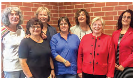
Der Vorstand der AsF Wesermarsch besuchte mich am Mittwoch während des Plenums.

Wiedervereinigung, hervorragende wirtschaftliche Lage und, und, und. Ich bin stolz auf das was wir schon geschafft haben und wir haben noch viel vor!